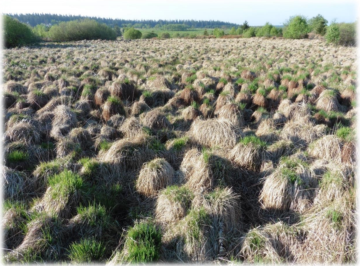
Foto hierboven is het pijpenstrootje in het voorjaar. Hier kan je duidelijk zien dat het pijpenstrootje groeit op bulten. Het is nagenoeg onmogelijk om een gebied waar het pijpenstrootje voorkomt te doorkruisen als er geen paden zijn.

Vroeger werd het gras gebruik voor vlechtwerk. Ook werden er bezems mee gemaakt. En uiteraard werd de binnenkant van de steel van de pijp hiermee ook gereinigd.