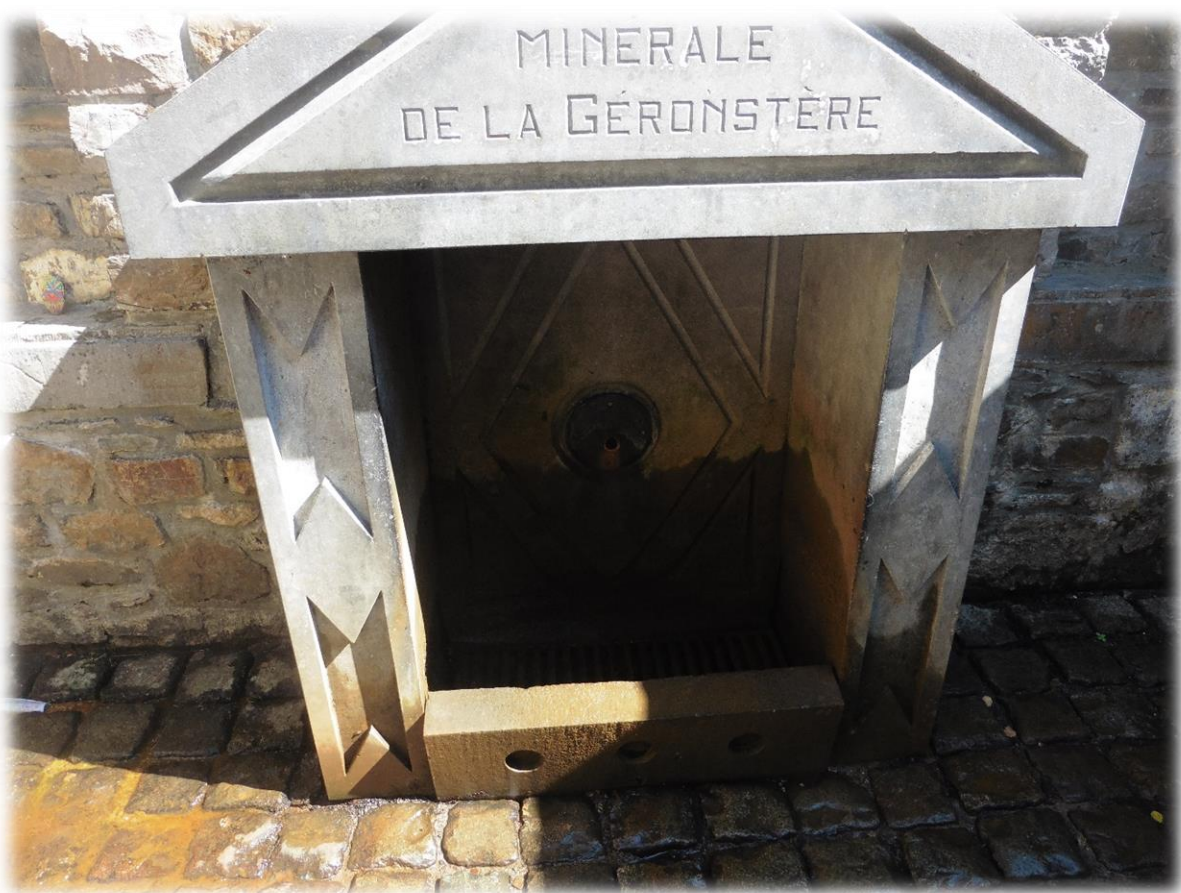
De Géronstère bron zou door tsaar Peter de Grote regelmatig bezocht zijn. Het water heeft een zwavelsmaak en het ijzerhoudende en koolzuurhoudende water wordt in de volksmond aanbevolen voor aandoeningen van de luchtwegen.