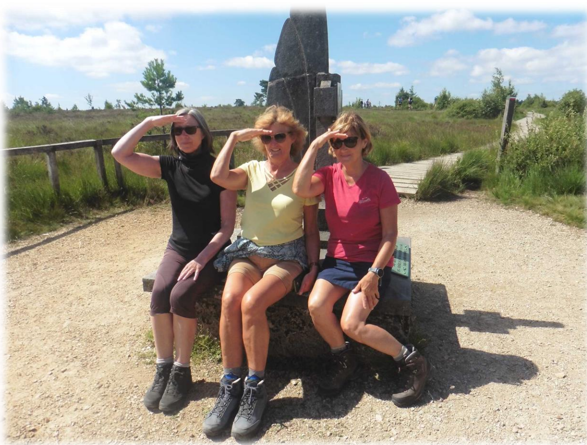
Deze drie dames vormen de kleuren van de Belgische vlag.