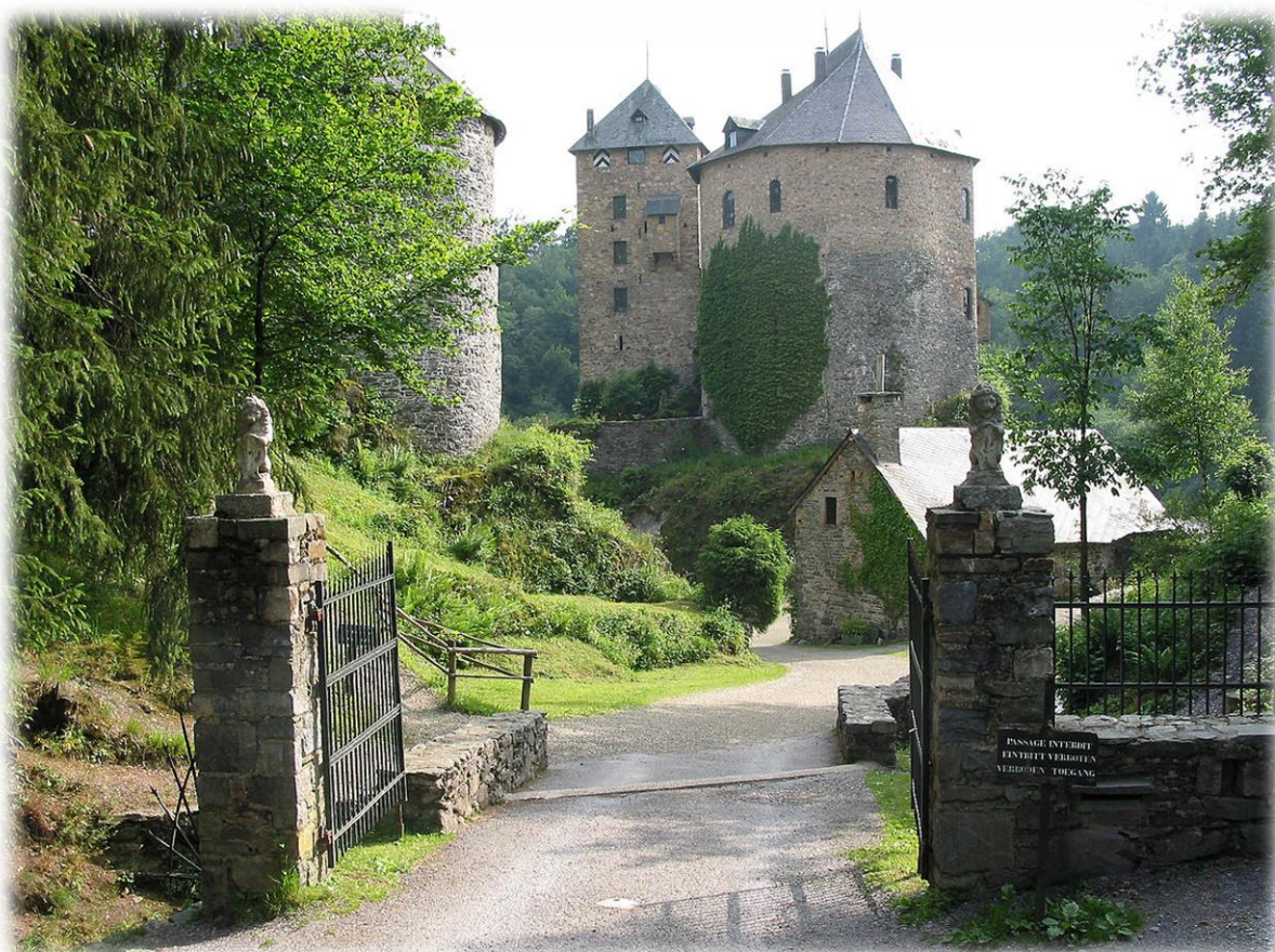
Kasteel Reinhardstein. Het kasteel, vandaag uniek in België, werd opgetrokken in 1354. Nadat het was vernield, werd het vanaf 1969 herbouwd in overeenstemming met